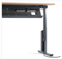
Kabelkanal und -kette