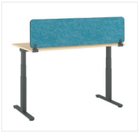
Sichtschutz oberhalb des Tisches

Divisio und Partito Screens und Paneele in verschiedenen Konfigurationen können als Sichtschutz oder Blenden zum Einsatz kommen. Das Paneel aus Stahl mit Blende sowie das seitliche Paneel aus Stahl mit Blende sind exklusiv nur für Migration SE erhältlich.