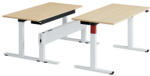
Migration SE Bench mit zentralem Fence