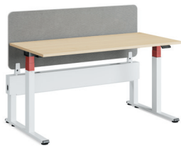
Migration SE Einseitige Benchlösung