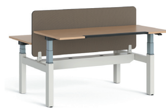
Migration SE Bench in H-Form