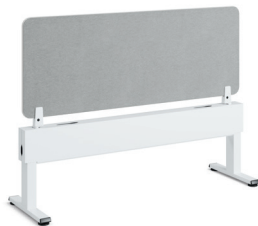
Migration SE Freistehender Fence