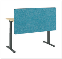
Sichtschutz oberhalb des Tisches/Sichtschutz mit Blende