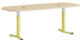
Migration SE Höhenverstellbarer Besprechungstisch mit T-Fußgestell

Der höhenverstellbare Besprechungstisch Migration SE ermöglicht den Nutzer*innen, ihre Körperhaltung ganz einfach per Knopfdruck zu ändern. Meetings werden flexibler, was wiederum die Produktivität steigert. Der Tisch kann in vielen verschiedenen Settings genutzt werden, von Teambereichen über Zonen für Kleingruppen bis hin zu Besprechungsbereichen. Die Settings können entsprechend der jeweiligen Bedürfnisse des Teams angepasst werden - auf Knopfdruck wird aus einem traditionellen Besprechungszimmer ein Ort für Stand Up-Meetings oder flexible Brainstorming Sessions.