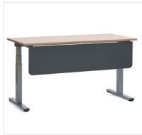
Blende aus Stahl