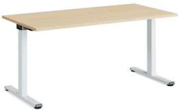
Migration SE Freistehender Tisch

Die höhenverstellbaren Schreibtische und Benches von Migration SE bieten langfristige Flexibilität, denn die Benchkonfigurationen können wieder in Tische aufgeteilt werden und umgekehrt. Tische in starrer Höhe können mit nur wenigen zusätzlichen Teilen zu höhenverstellbaren Tischen angepasst werden.