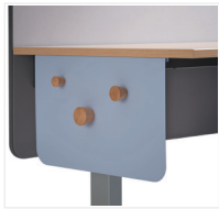
Seitliche Blende mit Holzknöpfen*